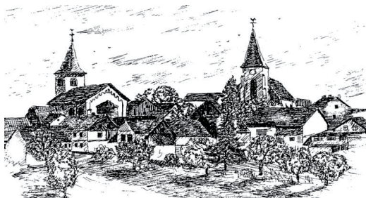
Laubach, ein Dorf im Hunsrück

Haftung: Der Veranstalter haftet nicht für Unfälle, Diebstähle oder sonstige Schäden.