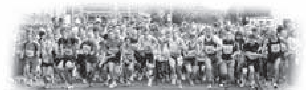
Start des Hauptlaufs (oben).