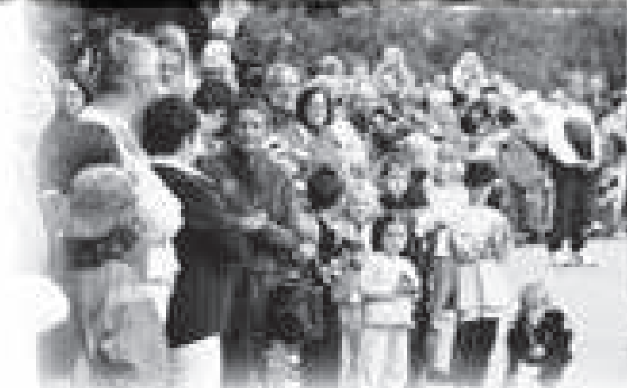
weitere Impressionen auf Seite 29