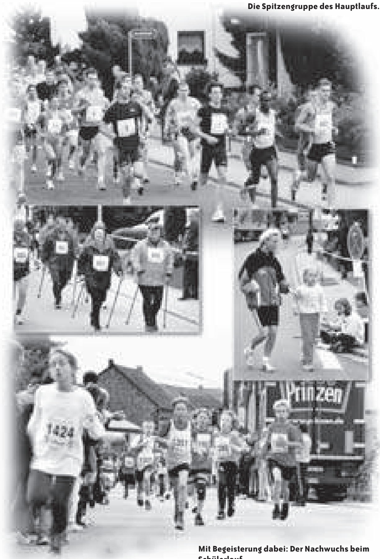
Mit Begeisterung dabei: Der Nachwuchs beim Schülerlauf.