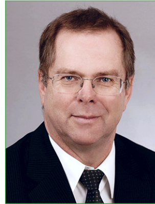
Klaus Lotz Präsident des Leichtathletik- Verbandes Rheinland