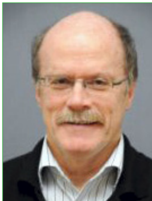
Helmut Liesenfeld Leiter der Leitstelle Kriminalprävention im rheinland-pfälzischen Innenministerium